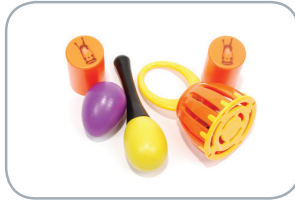
Shakers y campanas