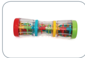
Palo de agua