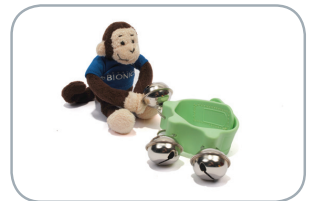
Campanillas para niños pequeños