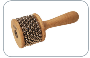
Cabasa (o afuché)