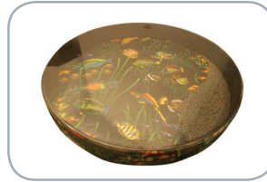
Tambor de mar grande